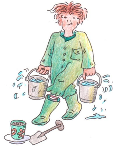
Tekening: Carel Bruens